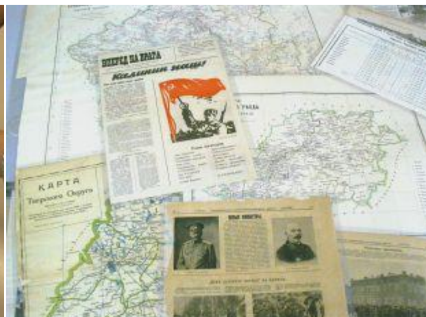
Инкапсулированные краеведческие материалы