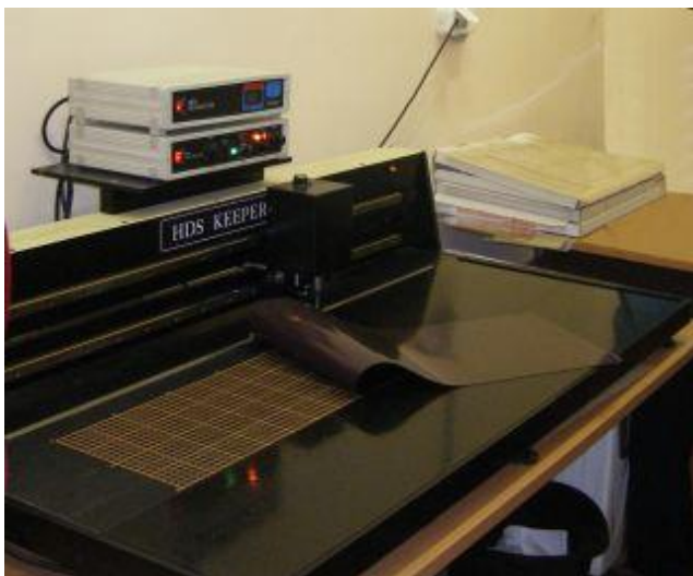
Установка для инкапсулирования документов в Федеральном центре консервации при РНБ

механического повреждения, пыли. Документ вкладывают между листами пленки, края которой запаивают с помощью ультразвука на специальной установке. После инкапсулирования даже хрупкие документы будут служить читателям долгое время.