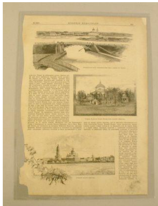
Бумажные издания до и после реставрации